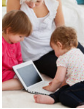
Esperanza ante el autismo