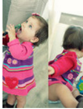
Una casa segura para el bebé