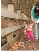
El niño tiene las piernas...