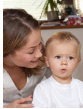
No sé si mi hijo oye bien